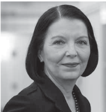
Dr. Christine Hohmann-Dennhardt

Die ehemalige Bundesverfassungsrichterin Dr. Christine Hohmann-Dennhardt soll beim Stuttgarter Autobauer künftig ein Auge auf „Integrität und Recht“ im Unternehmen haben. Wie die Daimler AG am vergangenen Dienstag mitteilte, wurde Dr. Hohmann-Dennhardt mit Wirkung vom 16.02.2011 bis 28.02.2014 zum Mitglied des Vorstands für das neu geschaffene Ressort bestellt. Damit beruft