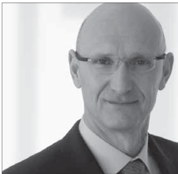
Timotheus Höttges

Telekom-Vorstand Timotheus Höttges ist in das Präsidium des Hightech-Verbands BITKOM gewählt worden. Er folgt damit auf René Obermann, der die Telekom seit 2004 im BITKOM-Präsidium vertreten hatte und zum 1. Januar 2014 zum niederländischen Kabelnetzbetreiber Ziggo N.V. wechselt. In Anerkennung seines Engagements