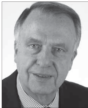
Bernd Neumann

Der Verwaltungsrat der FFA setzt sich aus 36 Mitgliedern zusammen, die vom Bundestag, der Bundesregierung und Verbänden der Filmwirtschaft delegiert und für eine Amtsperiode von fünf Jahren berufen werden. Nach seiner Wahl erklärte Bernd Neumann: „Ich danke der Filmwirtschaft, aus