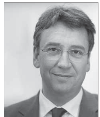
Andreas Mundt © Bundeskartellamt

verfügt zwar über eine überlegene Marktstellung im Pay-TV Bereich. Durch den geplanten Erwerb wird diese Marktposition aber nicht in einem wettbewerblich relevanten Maße verstärkt.“ (al)