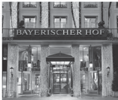
Hotel Bayerischer Hof Promenadeplatz 2-6, 80333 München

Nutzen Sie die Möglichkeit zu fachlicher Diskussion und persönlichem Networking bei unserem traditionsreichen MARKENFORUM® .