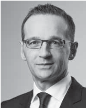
Bundesminister Heiko Maas

Das Bundesministerium der Justiz und für Verbraucherschutz (BMJV) hat die Mittel für den Aufbau des „Marktwächters Finanzmarkt“ und des „Marktwächters Digitale Welt“ freigegeben. Ab 2015 sollen sie den Markt beobachten und nach der Devise „Erkennen – Informieren – Handeln“ die Interessen der Verbraucher durchsetzen helfen. Die Marktwächter sind ein gemeinsames Vorhaben des Verbraucher-