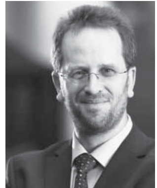
Klaus Müller

Das BMJV stellt mit einer Anschubfinanzierung in Höhe von 1,5 Millionen Euro die Mittel für die Konzeption der Marktwächter bereit. Ab Februar 2015 können die Marktwächter dann aufgebaut werden. Der vzbv und die Verbraucherzentralen werden mit den Marktwächtern den Finanzmarkt und die digitalen Märkte systematisch beobachten, Verbraucherprobleme erfassen und identifizieren, Politik, Behörden und Verbraucher regelmäßig informieren sowie ihre recht-