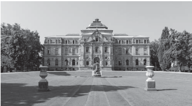
Der I. Zivilsenat beim BGH verneint die Störer-Haftung bei passwortgesichertem WLAN

Das Internet bietet viel Raum und auch viele Möglichkeiten für illegale Aktivitäten. Die Geschädigten haben es meist schwer, ihre Rechte durchzusetzen, weil der Verursacher des Schadens nicht klar erkennbar oder identifizierbar ist. Die Hilfskonstruktion, den „Verbreiter“ der bösen Tat in die Pflicht zu nehmen, greift nicht immer. Hier hat jetzt der Bundesgerichtshof in Karlsruhe ein wegweisendes Urteil gefällt, das die sogenannte Störer-Haftung bei Verletzungen des Urheberrechts betrifft. Wenn ein WLAN-Anschluss in angemessener und üblicher Form passwortgesichert ist, dann haftet der Anschluss-Inhaber nicht für illegale Aktivitäten Dritter, das hat der unter anderem für das Urheberrecht zuständige I. Zivilsenat entschieden (Urteil vom 24. Nov. 2016 – Az.: I ZR 220/15).