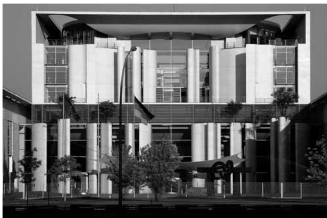
Das Bundeskanzleramt mit Erfolg und Niederlage beim OVG Berlin-Brandenburg

Das Oberverwaltungsgericht Berlin-Brandenburg hat in zwei vorläufigen Rechtsschutzverfahren über die Verpflichtung des Bundeskanzleramts entschieden, ob Journalisten Auskunft über den Inhalt von Akten zu geben ist (Beschlüsse vom 3. Aug. 2017 – Az.: OVG 6 S 9.17 und OVG 6 S 12.17). Ein Verfahren ist zugunsten der Presse-Freiheit ausgegangen, das andere nicht. Beide Beschlüsse sind unanfechtbar.