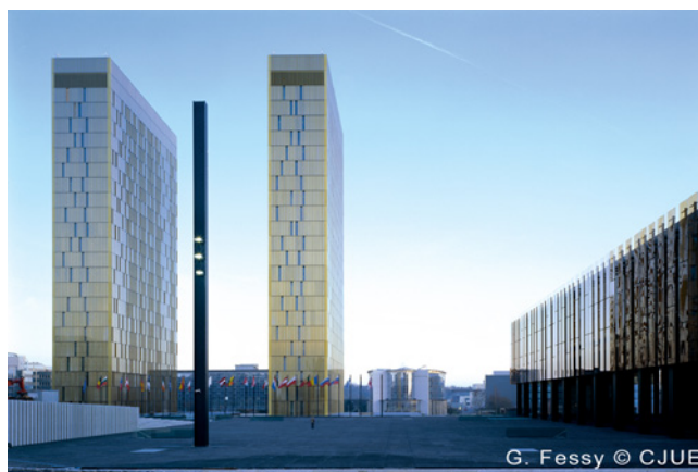
Die EuGH-Richter sehen im Verbot regionaler TV-Werbung einen möglichen Verstoß gegen EU-Recht

Verhältnismäßigkeit des § 7 Abs. 11 RStV (nunmehr § 8 Abs. 11 MStV), der von den deutschen Gesetzgebern auf Landesebene insbesondere aus Gründen der Sicherung der Medien-Vielfalt eingeführt wurde.