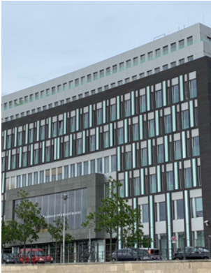
Der Vorstand der Bundespresse-Konferenz wehrt sich gegen Hasskommentare im Internet

Im Zusammenhang mit der Berichterstattung über die Bundespresse-Konferenz (BPK) sind seit dem 3. Mai 2021 auf den beiden Inter-