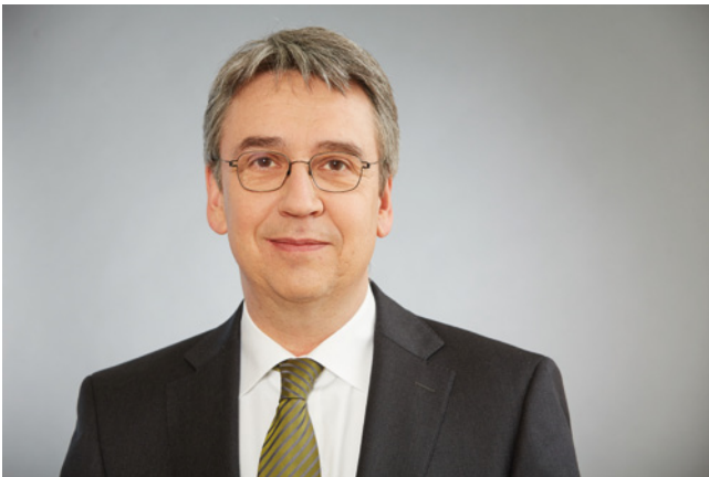
Andreas Mundt, Präsident des Bundeskartellamtes: „Amazon ist der zentrale Schlüsselspieler des E-Commerce.“

Für den Online-Giganten Amazon gelten ab sofort verschärfte Regeln. Das Bundeskartellamt in Bonn hat am 5. Juli 2022 entschieden, dass die Amazon.com Inc. mit Sitz in Seattle / USA ein Unternehmen mit überragender marktübergreifender Bedeutung für den Wettbewerb ist. Damit unterfällt Amazon gemeinsam mit seinen Tochter-Unternehmen der erweiterten Missbrauchsaufsicht des § 19a GWB. Die Entscheidung des Bundeskartellamtes ist gemäß den gesetzlichen Vorgaben auf fünf Jahre befristet.