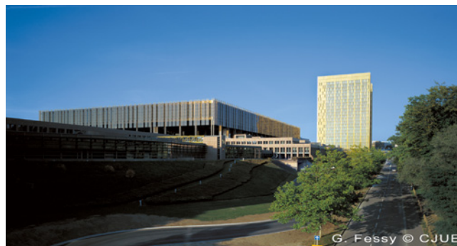
Der Europäische Gerichtshof mit Sitz in Luxemburg hat die Rechte der Marken-Inhaber gegenüber den Plattform-Betreibern deutlich gestärkt

Die Marke Louboutins ist für die rote Sohle der Luxus-Schuhe bekannt und auch europaweit als Markenzeichen geschützt. Auf den Websites von Amazon erscheinen regelmäßig Verkaufsanzeigen für rot-besohlte Schuhe, die laut Christian Louboutins ohne seine Zustimmung in Verkehr gebracht worden sind.