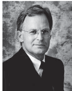
Franz-Peter Falke Präsident des Markenverbandes

Die Bundesregierung hat den Entwurf eines Gesetzes zur Umsetzung der EU-Durchsetzungsrichtlinie, deren Ziel ein verbesserter grenzüberschreitender Schutz des Geistigen Eigentums ist, beschlossen.