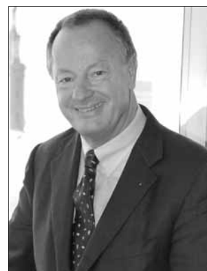
Axel C. Filges

Dazu BRAK-Präsident Axel C. Filges : „Neben organisatorischen Fragen werden wir uns intensiv mit der personellen Besetzung der Schlichtungsstelle befassen. Es gilt, für die Position des