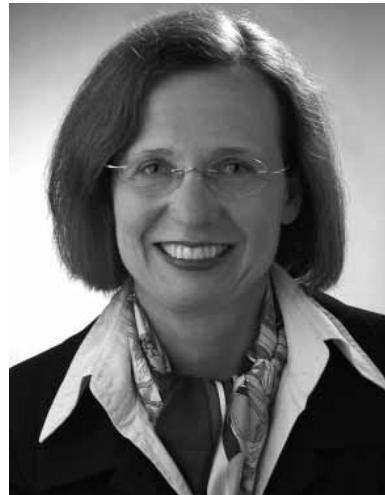
Dr. Regina Hock

Das Symposium wurde vom Bundespatentgericht erstmals 2007 im Rahmen der deutschen EU-Ratspräsidentschaft unter dem Motto „Die Zukunft der Patentgerichtsbarkeit in Europa“ organisiert. Die Bedeutung